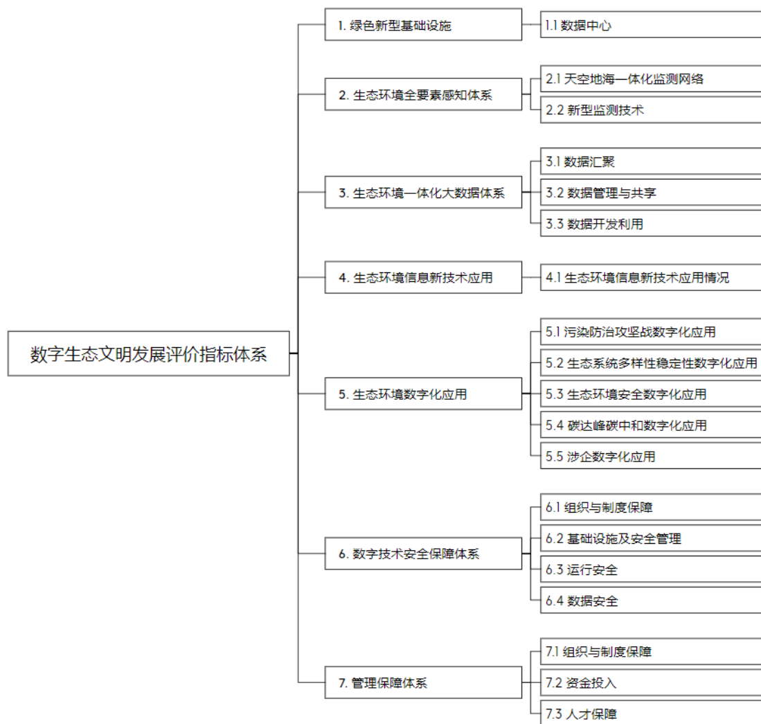
图 1 数字生态文明发展评价指标体系

数字生态文明发展评价指标体系包括绿色新型基础设施、生态环境全要素感知体系、生态环境一体化大数据体系、生态环境信息新技术应用、生态环境数字化应用、数字技术安全保障体系、管理保障体系 7 个一级指标。其中 7 个一级指标下辖合计 19 个二级指标（详见图 1）。